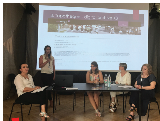
Predstavljanje Topoteke Vilijun na konferenciji Iseljenički turizam – globalna i nacionalna perspektiva u Zadru 1. srpnja 2017.

Suradnici na Topoteci Vilijun zalažu se za kreativna umrežavanja različitih kulturnih identiteta, a svojim su